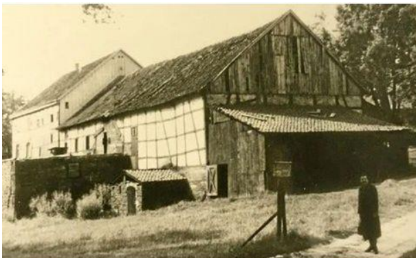
Unterste Kreuzenbeck früher

Auch die alten drei Kotten im Nachtigallental hatten die Bezeichnungen Oberste-, Mittelste- und Unterste- Kreuzenbeck. Von diesen drei Kotten besteht nur noch auf dem Grund von Unterste-Kreuzenbeck der Hof Spielkamp.