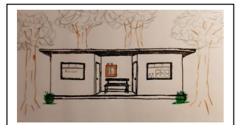
Handskizze Heinz Kaschulla

Links gab es den Verkaufsschalter für die Bahn-Fahrausweise etc., in der Mitte einen Wartebereich und rechts einen Kiosk mit allem Möglichem.