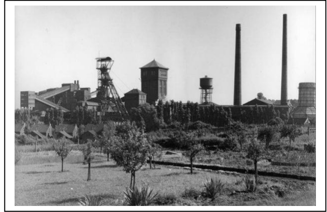
1959 Anfang

Die geförderte Kohle wurde bis 1872 mit Pferdewagen mühselig zur Ruhr gebracht. Da, wo es möglich war, ließ man die vollen Kohlewagen auf wenig abschüssigen Schienen-Strecken zur Ruhr rollen. Die leeren Wagen wurden dann mit Pferden wieder bergauf gezogen.