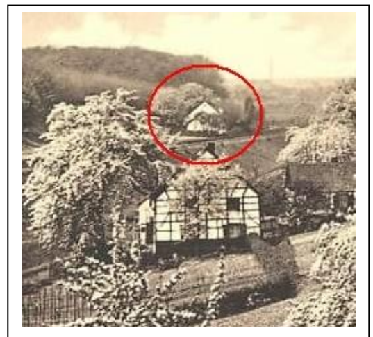
AK 018 Ausschnitt